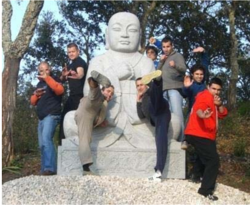
Some pictures and diversion, after a good training.