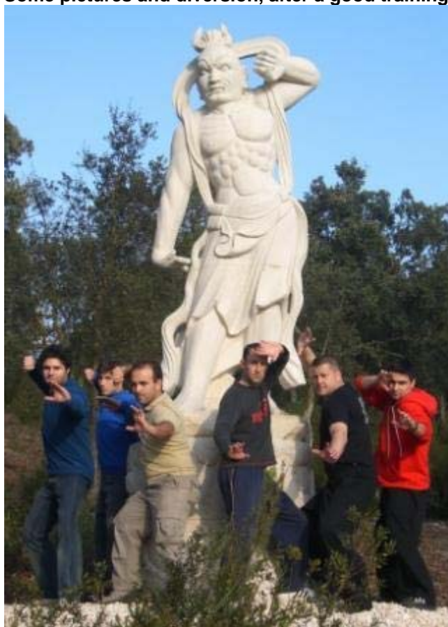
Farang Warriors in Fighting Stance.